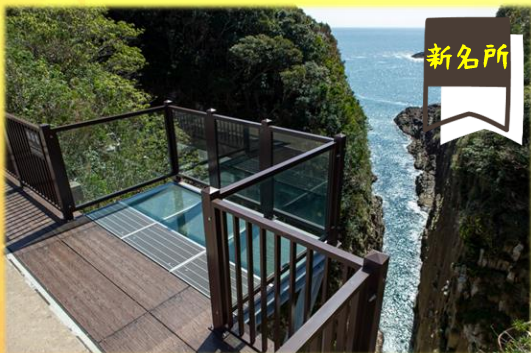
ガラス張り展望台「スケルツァ！」