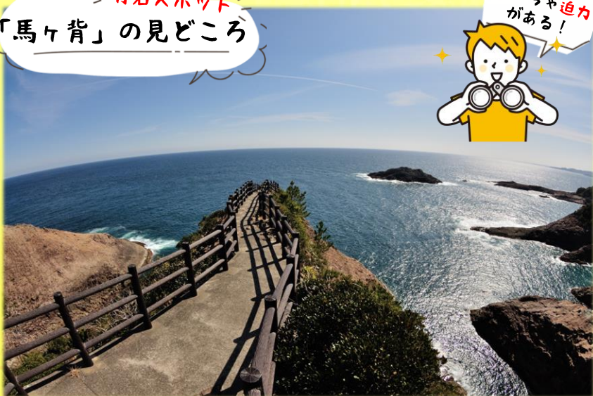
馬ヶ背の突端から望む太平洋の大パノラマ