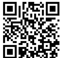
デジタルパンフレット

【移動時間のめやす】 日向市駅から 電動キックボードで約20分 日向ICから車で約15分