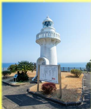
白亜の灯台「細島灯台」